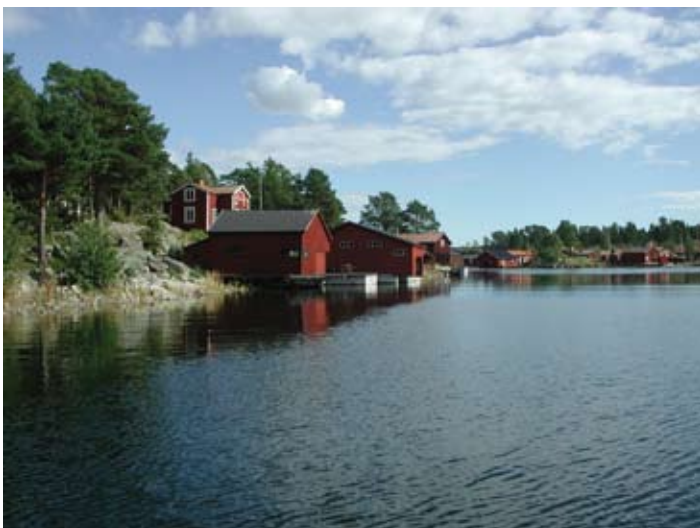
Vy över Kråkö hamn.

För information om transport med båt, kontakta Hudiksvalls turistbyrå.