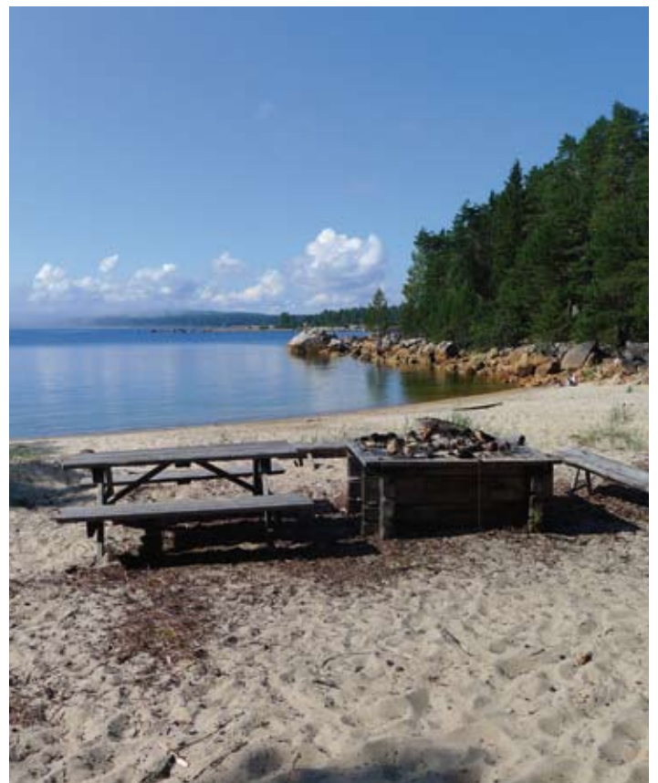
Rastplats i inre Skärkarlsviken i Vattingsmalarnas naturreservat.