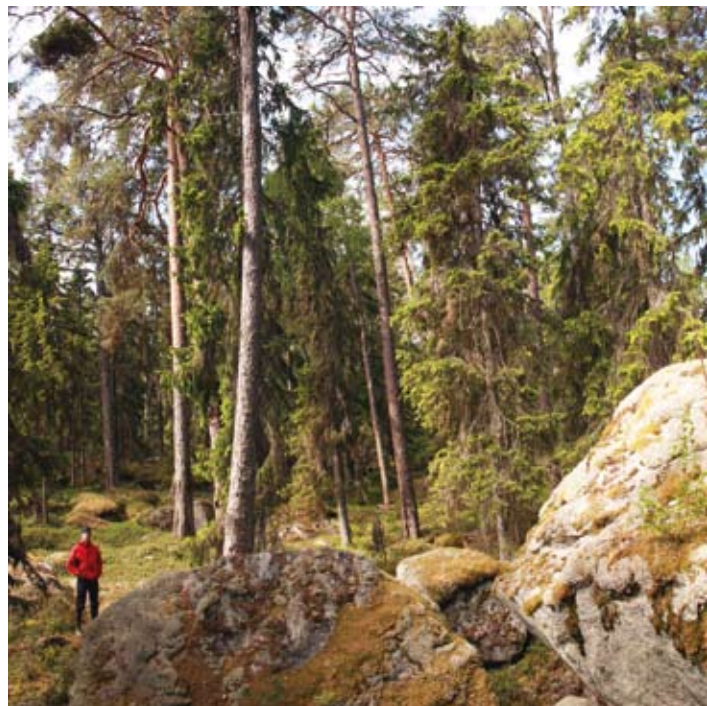
På upptäcksfärd på ön Kusö kalv i Axmars naturresevat.

Här blickar havsörnarna ut över en kust med mängder av sjöfåglar. Har du båt eller kajak kan du kliva iland på Kusön, naturresevatets största ö. Där finns fina badvikar med vindskydd, eldstad och dass. Förutom skärgårdsnaturen finns också historia att utforska över och under ytan. Längs Axmars undervattensstig ligger sjunkna skepp som var på väg till järnhytan i Axmar bruk. Hyttan står kvar idag, och här kan du följa järnbrukets storslagna uppgång och fall. Läs mer på www.axmarbruk.se och www.axmarbluepark.se