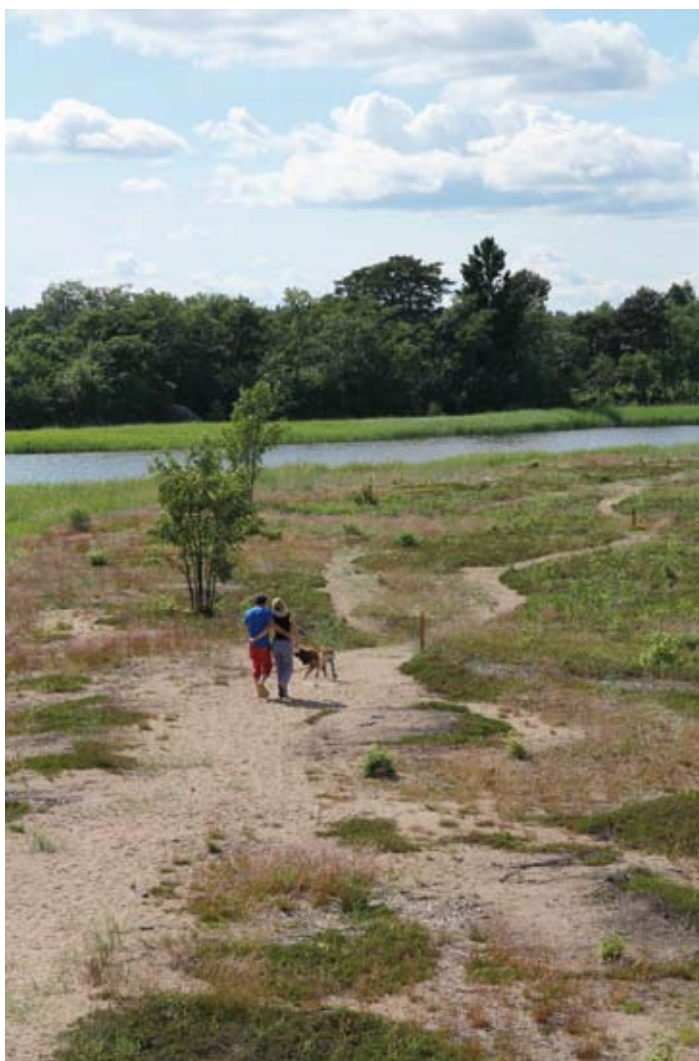
Vandring bland sanddynorna i Stenöorns naturresevat.

Stenöorns sandiga udde utanför Sandarne är en av Jungfrukustens bästa fågellokaler. Här kan du få se brushane, myrspov och kärnsnäppa som passerar under vår och höst. Har du otur med vädret ger fågeltornet regnskydd och lä i alla vindriktningar. Kom ihåg att från april till och med augusti är det bara tillåtet att gå längs den sandiga stigen ut till tornet. I resten av resevatet ska fåglarna kunna ta igen sig under flytten eller ta hand om sina ungar.