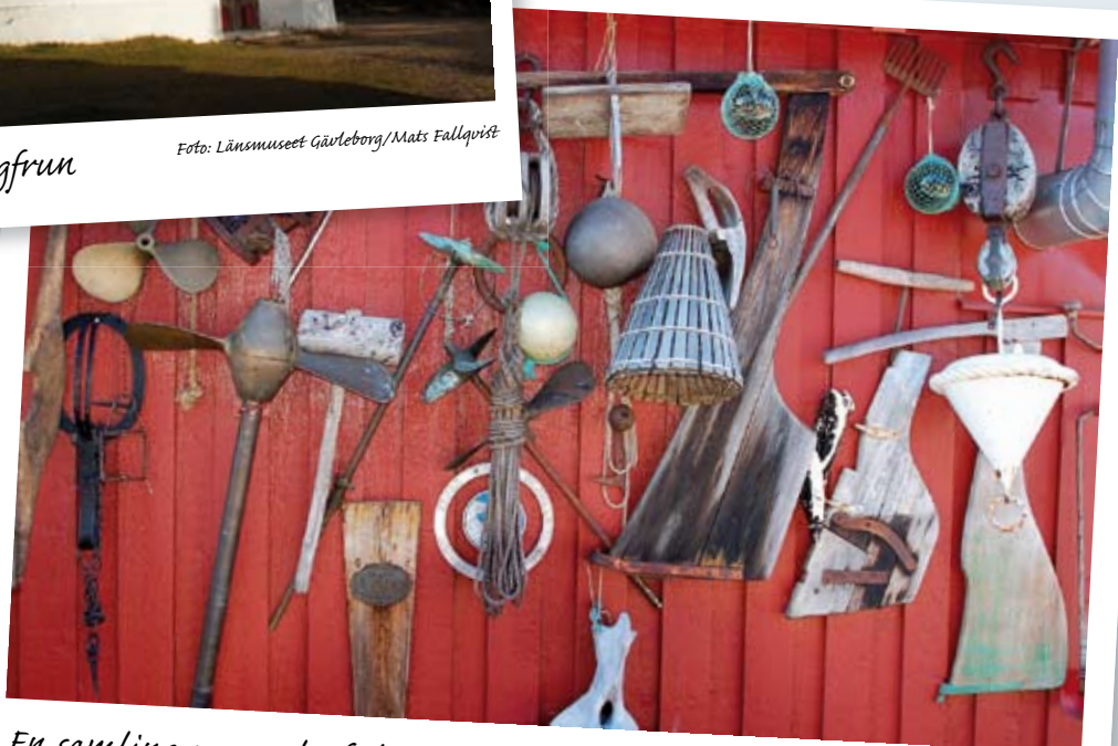
En samling av gamla fiskeredskap i Saltharsfjärden