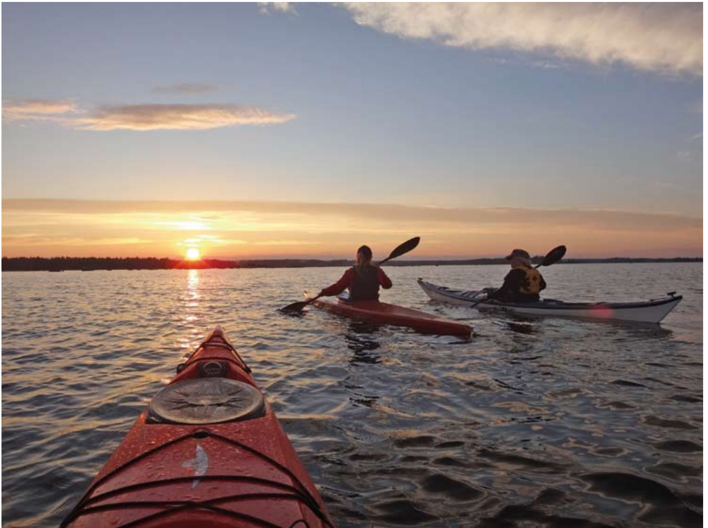
Hitta gärna ut till Jungfrukustens naturreservat med kajak.