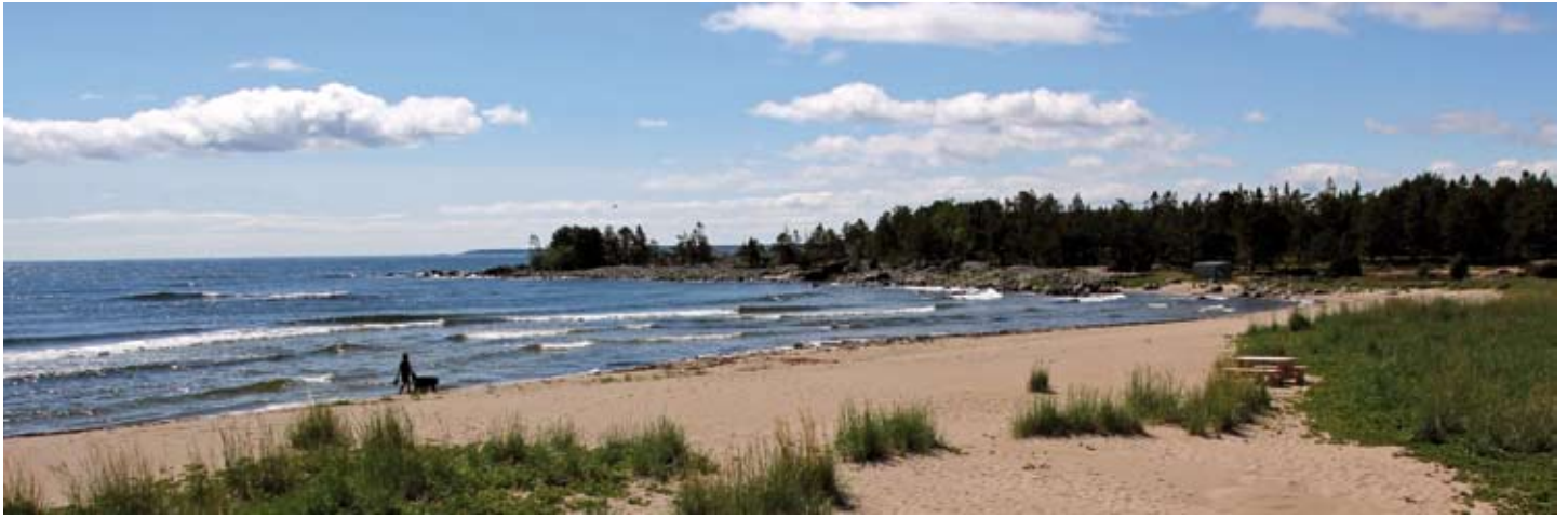
Höllicks naturreservat, Hälsingekustens egna riviera.