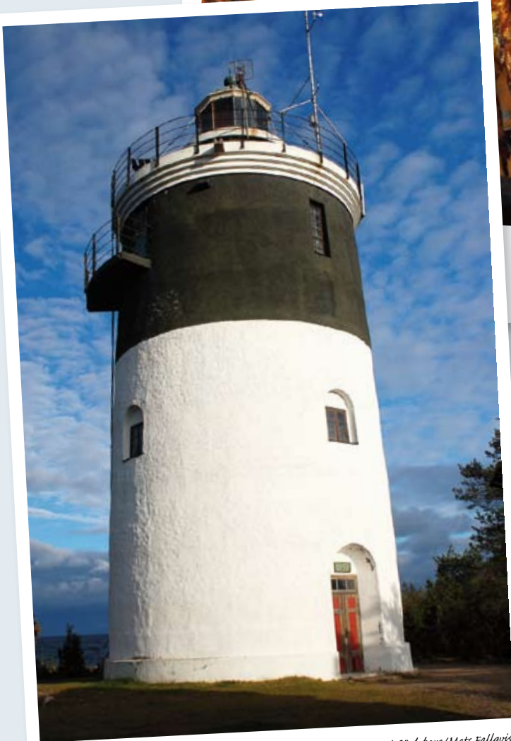
Eyren på Storjungfrun