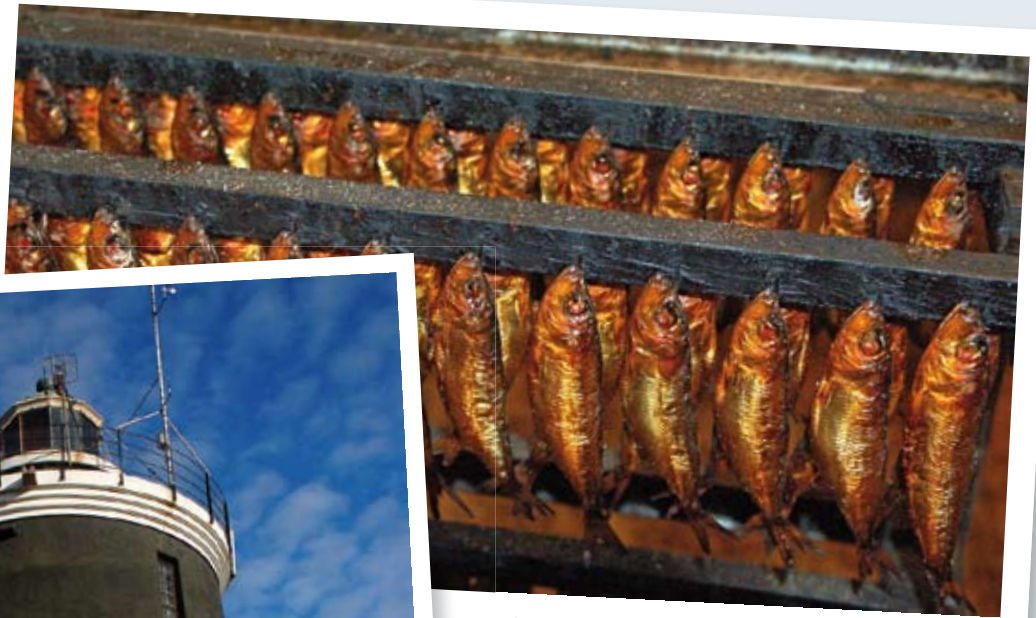
I Bönan utanför Gävle röks strömming till guldgul böckling med hjälp av granris