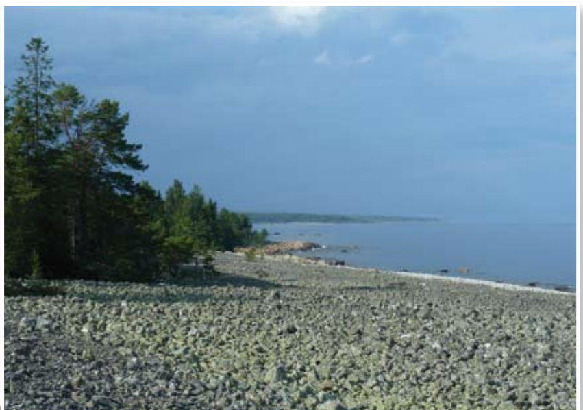
Klapperstensfält i Vattingsmalarnas naturreservat.

Länets största klapperstensfält sträcker sig en halv kilometer in från havet i Vattingsmalarnas naturreservat. Gamla strandlinjer bildar terrasser i stenfälten, som fortsätter i långa ränder. Ingenstans längs Gävleborgskusten finns så långsträckta och tydliga strandterrasser som här. De ligger i stort sett kvar som havet lämnade dem, när vatten snabbt sjönk till en lägre nivå och vågorna började forma en ny strandlinje med rundade stenar. Växtligheten vid klapperstensfälten är till största delen mager och består av ljung, blåbär, lingon, mjölon och odon.