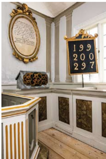
Läsarbänken och psalmnummertavlan i Agö kapell.

Fiskarkapellen har tagits väl om hand av brukarna, som velat behålla dem som de alltid sett ut. Men kapellen är i högsta grad ett levande kulturarv som fortfarande används och årligen besöks av mängder av personer. De är omtyckta besöksmål sommartid och levande gudstjänstrum som fortfarande används för dop och bröllop.