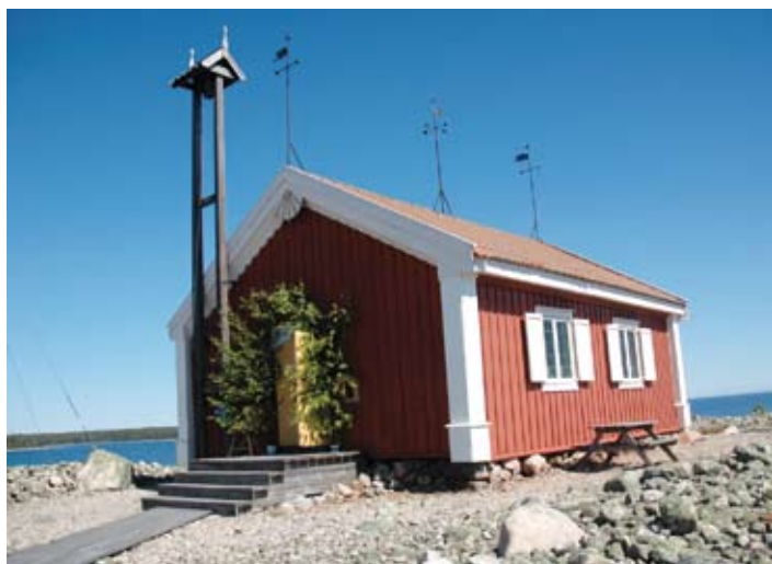
Kuggörarnas fiskarkapell.