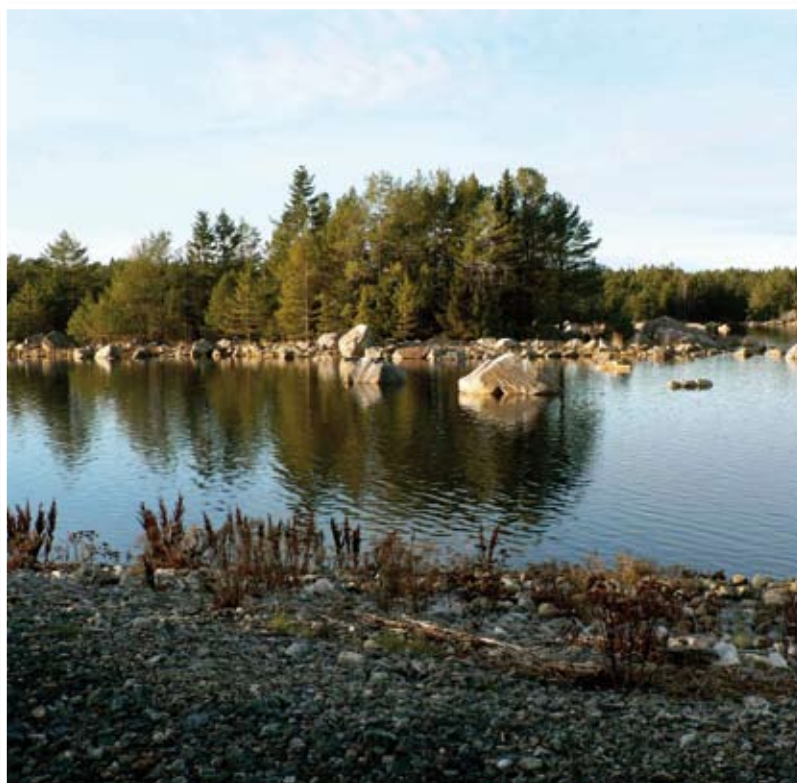
Vy över Notholmens naturreservat.