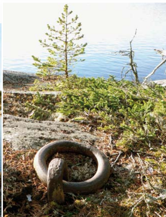
Ballasthamn vid Holmhällan i Notholmens naturreservat.