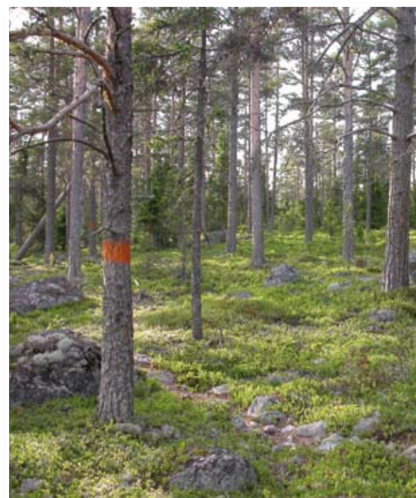
Vandra längs kustleden genom Klackuddens naturreservat.